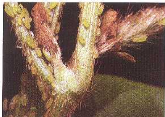
Kutu daun Aphis glycines pada batang kedelai