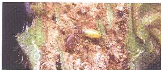
Kepompong lalat puuk Melanagromyza dolico stigma