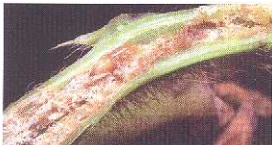
Kepompong lalat batang Melanagromyza sojae