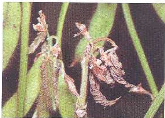
Gejala serangan lalat puuk Melanagromyza dolico stigma