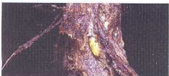
Kepompong lalat bibit Ophiomyia phaseoli