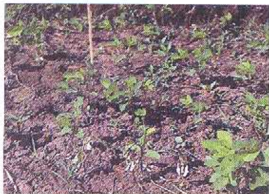
Gejala serangan lalat bibit Ophiomyia phaseoli