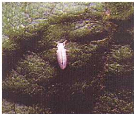
Kutu Kebul Bemisia tabaci