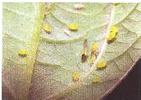
Kutu daun Aphis glycines pada daun