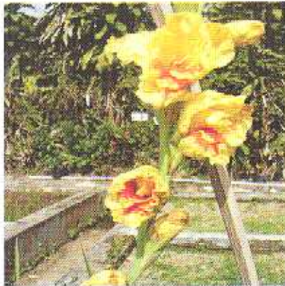
Bunga yang sudah mekar