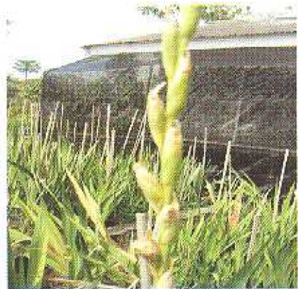
Bunga tidak bisa mekar