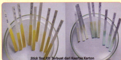
Stick Test Kit Terbuat dari Kaertas Karton